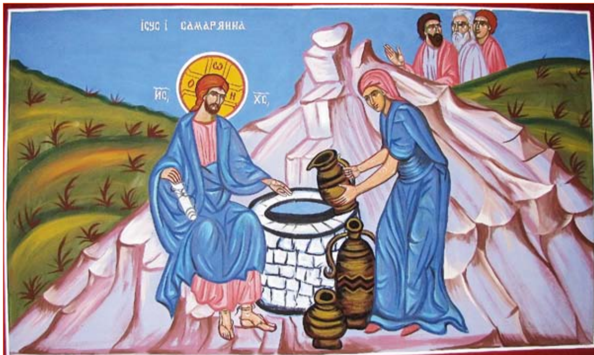
Ісус і самарянка, розпис в греко-католицькій церкві Всіх Святих в Гамбурзі, автор Данило Маруніч, монах з Сербії

ІСУС ПОЧАВ РОЗМОВЛЯТИ ІЗ САМАРЯНКОЮ ПРИ КОЛОДЯЗІ. ДЛЯ НАС В ТІМ НЕМАЄ НИЧОГО ДИВНОГО, А В ТІ ЧАСИ?